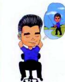
sanjarite i maštajte

Posvetite svaki dan malo vremena svome mentalnom zdravlju i osjećat ćete se bolje, s novim poletom za sve životne izazove. Ovo su neke jednostavne aktivnosti koje će poboljšati vašu mentalnu kondiciju.