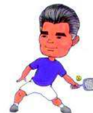
bavite se sportom