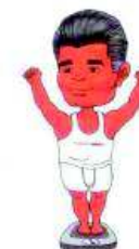
postarite si dostizanje cilja