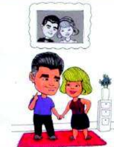
sjetite se sretnih dana