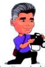
uživajte u hobijima